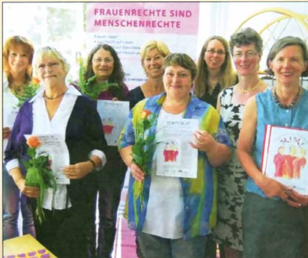
Die Teilnehmerinnen und Mitarbeiter des Projektes Mimi freuen sich über die erfolgreiche Zusammenarbeit.